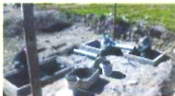
Construcción de la planta de tratamiento en el Centro Parroquial de Panzaleo