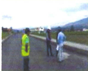
Mejoramiento de la capa asfáltica de la vía Pataín