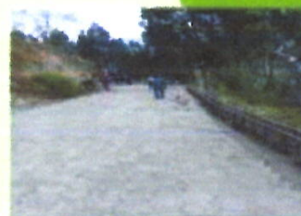
Dotación de adoquín y cemento para el adoquinado de la vía de ingreso al cementerio de la Comunidad de Lampata Chasqui