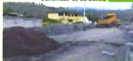
Dotación de material pétreo para la ejecución de los convenios de adoquinado de vías en la Comunidad de Tigualo, Lampata Chasqui y el Barrio San José de Jacho.