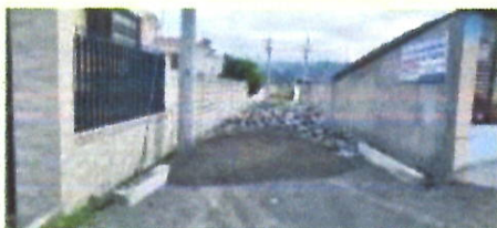
Dotación de maquinaria, adoquín y material pétreo para culminar el adoquinado de la vía ubicada en la ex línea férrea y las vías Virgilio Salazar y Ferroviaria