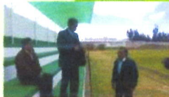
Construcción de la cubierta en los graderios del Estadio de la Comunidad de La Deficla