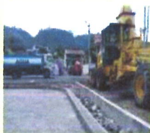
Dotación de maquinaria para la conformación de base y sub base de las vías adoquinar en la Comunidad de Tigualo y Lampata Chasqui.