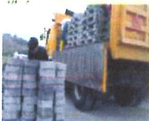
Dotación de adoquín y cemento para el adoquinado de la vía transversal de la casa comunal de Tigualo