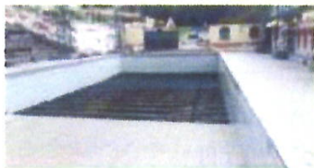
Mejoramiento de la infraestructura de las piscinas de Nagsiche